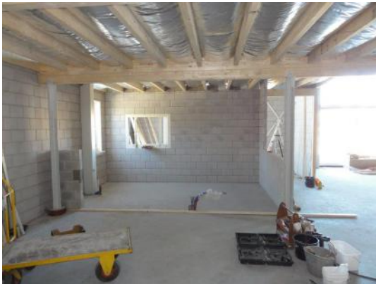
De verdieping in aanbouw.

We maakten in eigen beheer extra ruimte door een verdieping te realiseren ter grootte van een derde deel van het museum en een klein deel van de werkplaats (totaal plm. 200 m 2 ). Uiteraard is hierdoor ook een tweede (nood)trap noodzakelijk. Onder deze verdieping krijgen in het museum de restauratie, de toiletgroep voor bezoekers en de ruimte voor CV en luchtbehandeling hun plaats. Op deze verdieping zelf is er een multifunctionele ruimte, die geschikt is voor modelbouwactiviteiten, het onderhoud van museumstukken, filmvoorstellingen en het ontvangen van groepen bezoekers. Daarnaast is er nog een ruimte met een nog nader te bepalen bestemming. Onder de verdieping in de werkplaats komen de olieopslag, div. technische ruimtes, de toiletten t.b.v. de werkplaats, de zij-ingang en de trap. Op de verdieping zijn een kantine t.b.v. de werkplaats en div. opslagruimtes gepland. Een deel van het bovenstaande is in 2016 al in gebruik genomen.