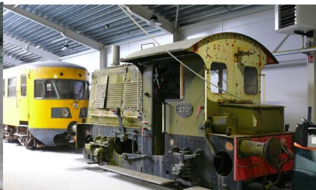
Onze Blauwe Engel en Sik op hun plek.