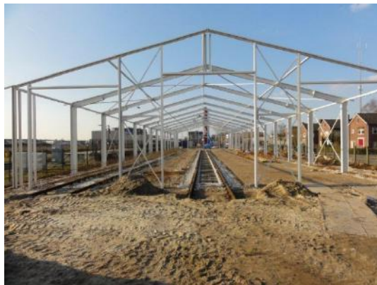
De spanten staan.