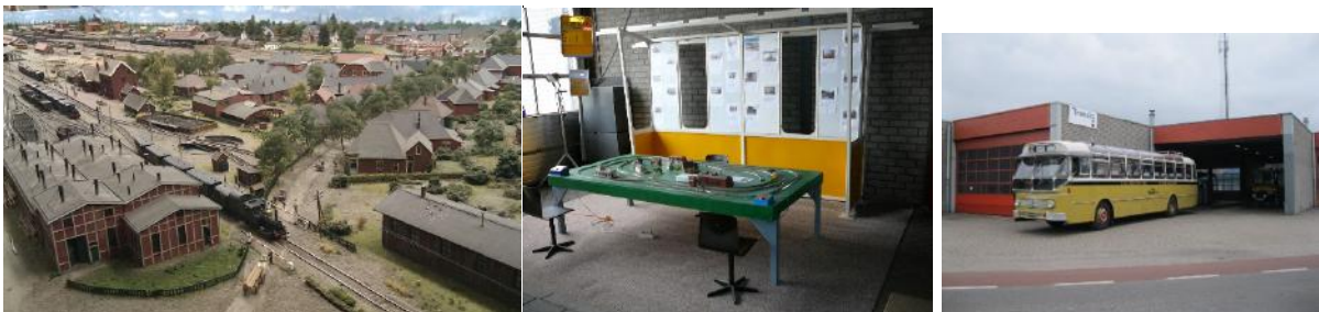
De modelbaan Winterswijk 1925, de speelbaan voor de kinderen, de grote bussen en de trein de "Blauwe Engel" waren de grote trekkers.

Tijdens de periode mei - september hebben we elke woensdag en zaterdag van 10 tot 16 uur het oude busstation opengesteld voor bezoekers. Onder begeleiding konden zij ook een kijkje nemen in de museumwerkplaats in aanbouw. Buiten de reguliere openingstijden hebben we verschillende groepen kunnen ontvangen. Er werd een rooster gemaakt, waarbij er tijdens de openingsdagen telkens vier vrijwilligers aanwezig waren; iedereen kreeg de gelegenheid met één van de vrijwilligers mee te lopen. Hun verhalen en toelichtingen werden in het algemeen zeer op prijs gesteld. Niet onvermeld mag blijven, dat onze PR goed werkte: Veel verblijfs-accommodaties in Winterswijk en omgeving kregen informatieve folders. Datzelfde gold voor de regionale VVV-'s. Voorts werd onze website goed bezocht. Het totaal aantal bezoekers was plm. 850. Een zeer groot succes werden de Themadagen: Medio oktober werd de geheel vrijgemaakte werkplaats en het nog lege museum ingericht met speciale attracties zoals een aantal modelbanen van onze vrijwilligers en speelbanen voor de kinderen. Ook waren er mini-vrachtauto's met plaats erin voor de jongsten en de mogelijkheid zelf een model van een huisje te bouwen. Daarnaast waren er enkele commerciële standhouders. Het resultaat was 1.500 bezoekers in dit weekend!!