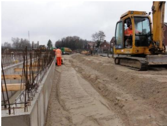
Het eerste grondwerk.