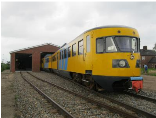
De trein voor het eerst de werkplaats in!