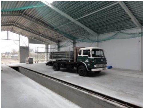
De vrachtwagen in de werkplaats.