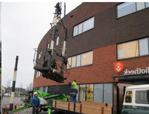
Ook de seinpaal werd verhuisd.